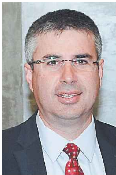
אשר (מימין) ולפייד. סמכויות נוספות לרשות המסים

דם בהליך מבלי שיש להן כסף להתגונן". הכנסת נמצאת כרגע בפגרה ותחזור לפעילות רק לאחר יום העצמאות. המי שמעוץ היא שמעבר לספק הרב שאופף את החוק שממתיין על שולחנה של ועדת החוקה, גם אם הוא יעבור בסופו של דבר, זה לא יהיה בטווח הקרוב, וסביר להניח שהוא לא יגדיל את הכנסות המדינה ב־2014. עם זאת, במקביל פועלת רשות המסים להגברת האכיפה והגבייה, וכבר ברבעון הנוכחי עברה את הערכותיה. מרשות המסים נמסר כי "החקיקה העור מדת על הפרק משתלבת בשורת מהלכים שהרשות מקדמת להעמקת הגבייה וכחלק מהמאבק בהון השחור, מתוך שאיפה לה גביר את השוויון בחלוקת נטל המס בקרב הציבור. המאמצים והמשאבים שמשקיעה הרשות בנושא החלו לשאת פירות כבר בשנה החולפת והיה להם חלק בהצלחה בגבייה מעבר לאומדן בשנת 2013 וליכור לת הממשלה לעמוד ביעד הגירעון".